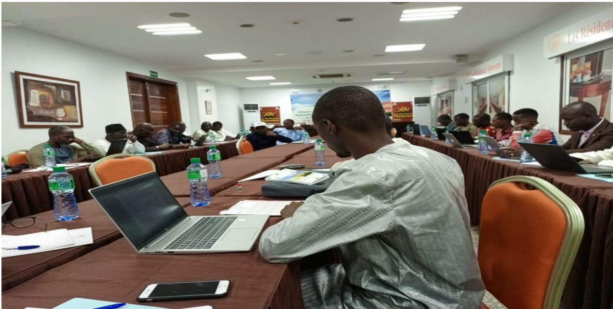
Photo de la salle au moment de la présentation.